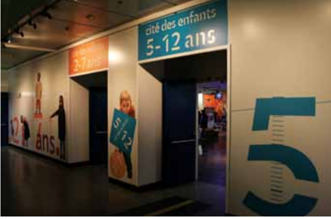
Paris'teki La Cité des sciences & de l'industrie (Bilim ve Endüstri Şehri). 3-7 ve 5-12 yaşlara uygun sergi ve etkinliklerin yer aldığı bölümün girişi.