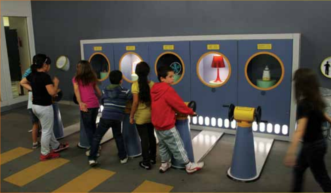
La Cité des sciences & de l'industrie, cam vitrinlerin ardında her biri farklı Watt'la çalışan elektrikli ev aletleri var. Her bir aletin önünde dinamo gibi çalışan, hareket enerjisini elektrik enerjisine dönüştüren bir bobin var. Ziyaretçi bobinin kolunu çevirerek ev aletlerini çalıştırmayı deniyor. Tabii daha çok elektrik harcayan aletleri çalıştırması için bobini daha çok döndürmesi ve daha çok enerji harcaması gerekiyor.

boyutuyla sunulmuyor. Sesinizi dijital olarak kaydettikten sonra frekansını değiştirerek kendi sesinizle oynayabiliyor, işitme frekansımızın çok üstünde ya da altında oldukları için doğada fark etmediğimiz sesleri duyabildiğiniz bir koridorda gezinti yapabiliyorsunuz. Ama hepsi bunla sınırlı değil: Değişik insan topluluklarının kullandığı dilleri, farklı milletlerden bebeklerin kaydedilmiş seslerinde henüz 10 aylıkken oluşmaya başlayan farklılaşmayı dinleme fırsatı buluyorsunuz. Kısaca ses ve işitme teması fizikten biyolojiye, sosyolojiden dil bilimine çok geniş bir perspektifte, görsel sanatlarla zenginleştirilmiş şekilde karşınıza çıkıyor.