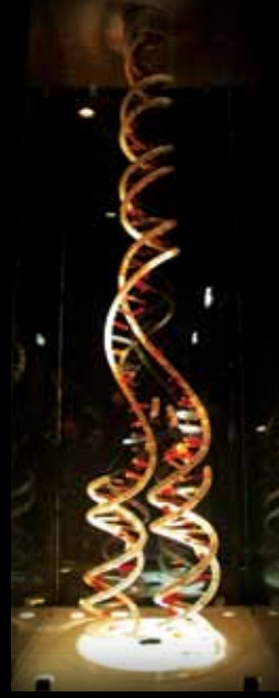
Le Palais de la découverte Bilim Merkezi , DNA'nın iki sarmal yapısının maketi