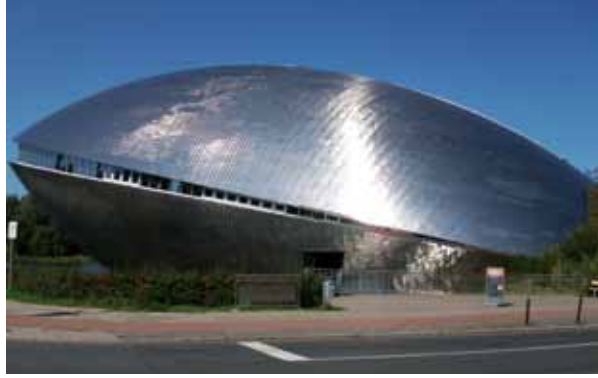
Almanya Bremen'deki Universum Bilim Merkezi