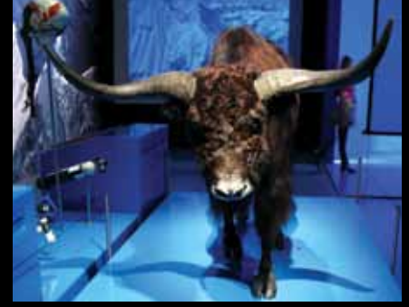
Le Palais de la découverte Bilim Merkezi'nde "Extreme Life" adındaki, uç yaşam koşullarını konu alan geçici sergide yer alan yüksek dağ ekosistemine uyum sağlamış tibet siğiri (yak)