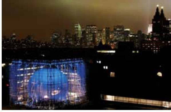
New York'taki Hayden Planetaryumu

Dünyadaki bilim merkezlerinde kalabalık okul ve ziyaretçi gruplarının giriş sırasını bekleyebileceği yüksek tavanlı giriş salonları, deney setlerinin, bilimsel CD'lerin, kitap ve oyuncakların, ziyaret edilen bilim merkezine özgü hatıra eşyalarının satıldığı hediyelik eşya satan dükkanlar, kafeler ve dinlenme köşeleri de bulunuyor.