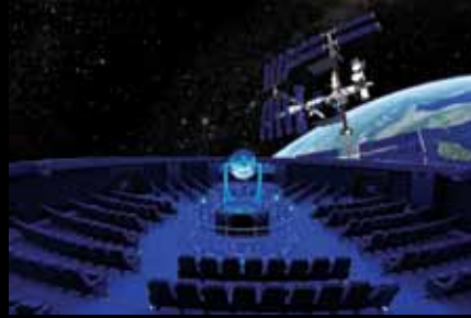
Ontario Bilim Merkezi, ziyaretçilerin uzay uçuşu kontrol merkezinde nasıl bir deneyim yaşadığını görebildiği, mekiklerin ve uyduların kalkışları hakkında bilgi edindikleri eğitim birimi

Dünya'daki büyük bilim merkezlerinin bir çoğunda planetarium (gezegenevi) bulunuyor. Planetariumu, oturdukları koltuklardan kubbe biçimindeki ekrana yansıtılan gök cisimlerini izleyen ziyaretçilere, uzmanların açıklamalarıyla eşlik ettiği bir astronomi tiyatrosu olarak tarif edebiliriz. Bu tiyatro salonunda yıldız projeksiyonunun kumandası elinde olan uzman ekrana yansıyan senaryoyu bir orkestra şefi gibi yönlendirebiliyor. Gerekirse kubbe de yansıyan gök cisimlerinin hareketlerini hızlandırıp yavaşlatabiliyor. İzleyiciler ekranda buldukları şehirden görülen gökyüzünün simülasyonunu ya da yıllar önceki herhangi bir gök olayını seyredebiliyor. Ülkemizde ODTÜ 'de gezici, 19 Mayıs ve Çağ üniversitelerinde ve İstanbul Deniz