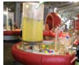
Mechelen-Brüksel'de bulunan Technopolis The Flemish Science Center'daki (Teknopolis Flaman Bilim Merkezi) "sahil" adlı sergi. Bu sergide ziyaretçiler suyla değişik deneyler yapıyor. Çarkları, engelleri ve pompaları kullanarak baraj inşa ediyor, periskop yapıyor, gemilerin neden yüzdüğünü ve denizaltıların neden battığını gözlemleyebiliyor.